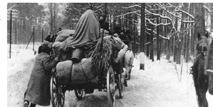
1945 in Schönwald: Flucht der deutschen Bevölkerung

Die Station in Oberschlesien führte die Delegation nach Gleiwitz. Im ehemaligen Dorf Schönwald, heute Gliwice-Bojków, legten die Mandatsträger an Gräbern polnischer Westerplatte-Soldaten, am Denkmal für die Opfer des Todesmarsches aus Auschwitz sowie am Massengrab für die von