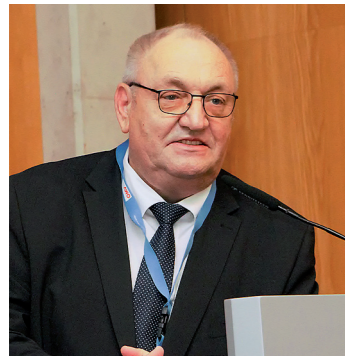
Erfreut: Bundesvorsitzender Primas

Zusagen werden eingehalten, und die im Koalitionsvertrag verankerten Ziele für die Vertriebenen-, Aussiedler- und Minderheitenpolitik werden Schritt für Schritt umgesetzt.