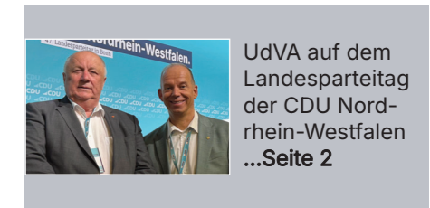
UdVA auf dem Landesparteiag der CDU Nordrhein-Westfalen ...Seite 2