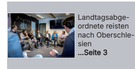
Landtagsabgeordnete reisten nach Oberschlesien ...Seite 3