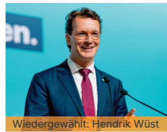
Wiedergewählt: Hendrik Wüst