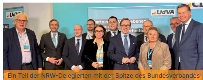
Ein Teil der NRW-Delegierten mit der Spitze des Bundesverbandes